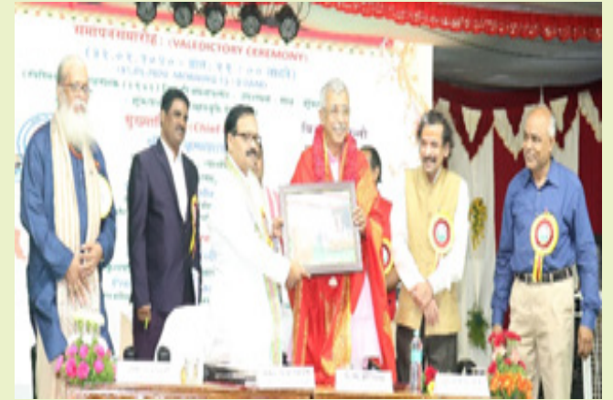
मुख्यतिथीन् सम्मानयन्तः मान्याः कुलपतयः