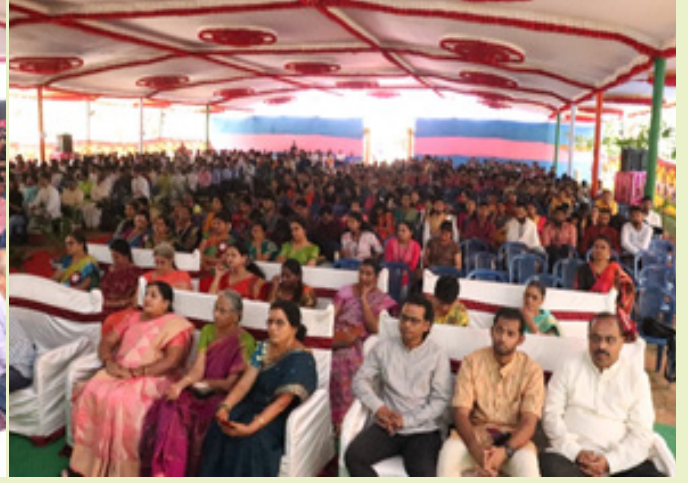
समारोपकार्यक्रमे समवेतः जनस्तोमः