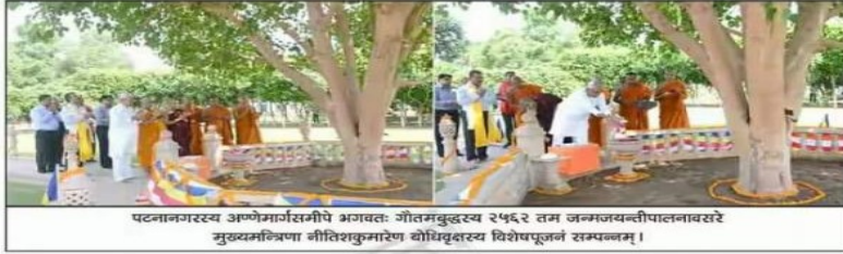
पटनानगरस्य अण्णोमार्गसमीपे भगवतः गौतमकुलस्य २५६२ तम जन्मजयन्तीपालनावसरे मुख्यमन्त्रिणा नीतिशकुमारेण बोधिचूडस्य विशेषपूजनं सम्पन्नम् ।