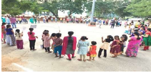
अभिमन्युबालकेन्द्रस्य छात्राः भाषाक्रीडायां निमग्नाः सन्ति