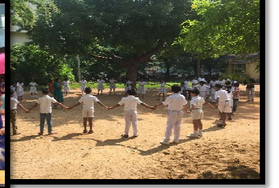
बालाः बालकेन्द्रे भाषाक्रीडां क्रीडन्तः सन्ति