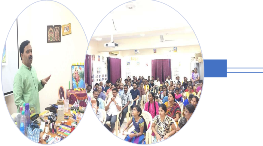
शिविरस्य उद्धटनावसरे कुलपतेः भाषणम्