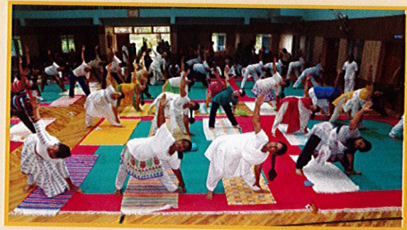
उत्सवे भागग्रहीतृभिः योगकौशलप्रदर्शनम्

उच्चा दिवि दक्षिणावन्तो अस्थुः - ऋ. १०.१०७.२ :: The liberal stay high in the celestial region