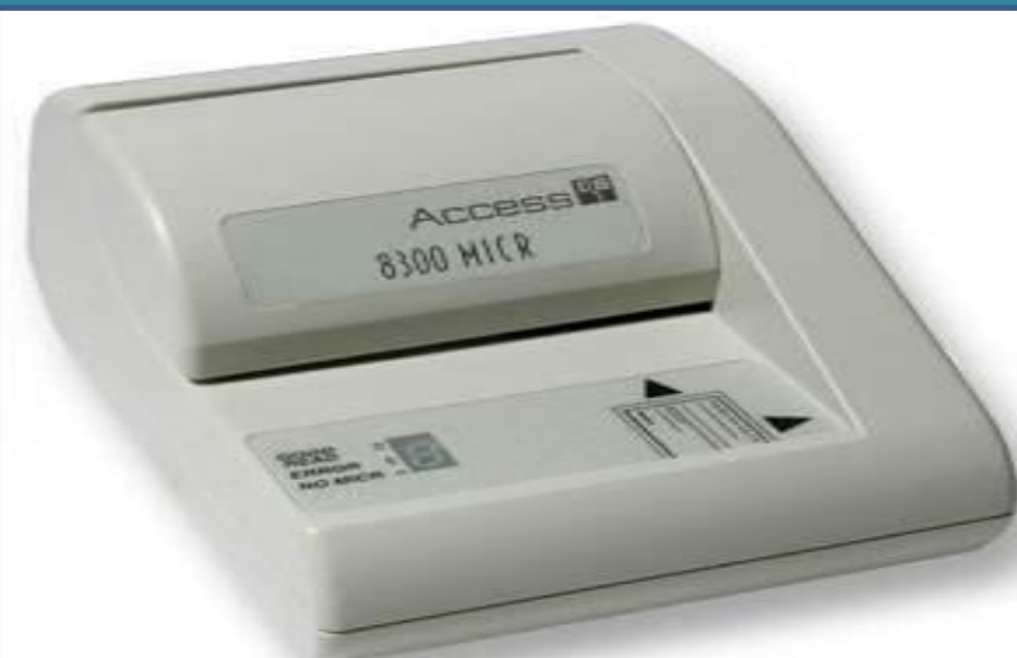
Magnetic Ink Card Reader (MICR)