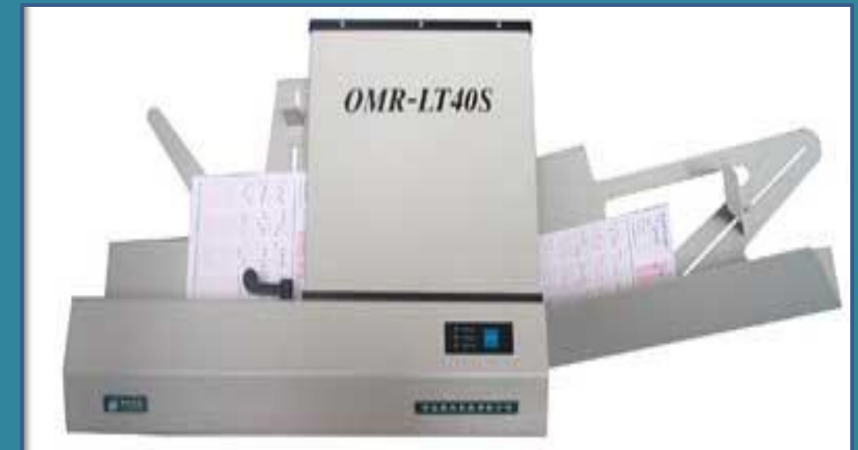
Optical Mark Reader (OMR)