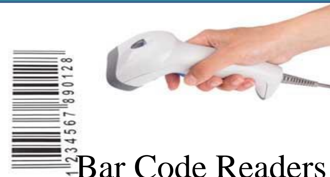
Bar Code Readers