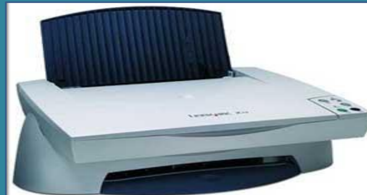
Optical Character Reader (OCR)