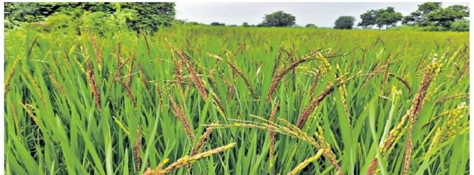
Instead of urea and other pesticides, Vruksha Ayurvedic method is being practised to protect the black rice (Krishna rice) crop from parasites and insects to get high yield.

Rs 50,000 per quintal Speaking to Telangana Today, Koutilya Krishna