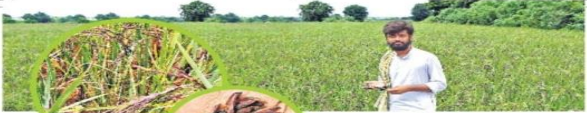
'యా పూర్వ్యా మావాస్యా సా సిరీదాతి' - ఇతరీయాచరిష్యన్